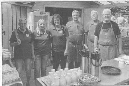
Wir erwarten Sie zur Vatertagshocketse!